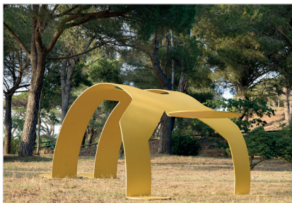
Sans titre (Yellow Arching Figure), 1985 Acier peint 189 x 528 x 307 cm

Œuvres : © Keith Haring Foundation, 2021