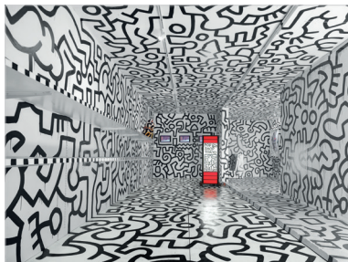
Pop Shop Tokyo, 1988 Intérieur Technique mixte sur bois, plâtre et acier 236 x 1200 x 496 cm