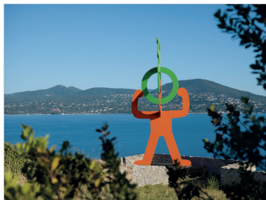
Sans titre (Headstand), 1987-1988 Acier peint 700 x 300 x 300 cm